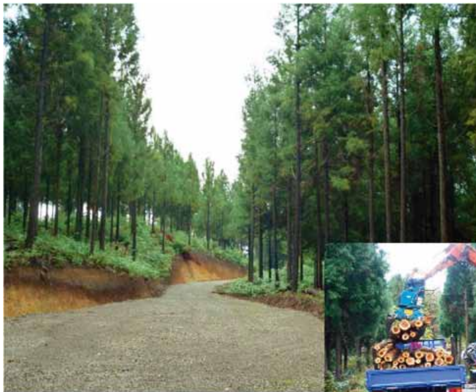
上山田団地(かほく市上山田地内)に開設された作業道