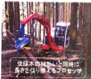
伐採木の枝払いと同時に 長さを伐り揃えるプロセッサ

労働生産性が向上 (H12) 1.2 → (H18) 5.0 m 3 /人日 1人当たりの生産量が4.2倍に増加